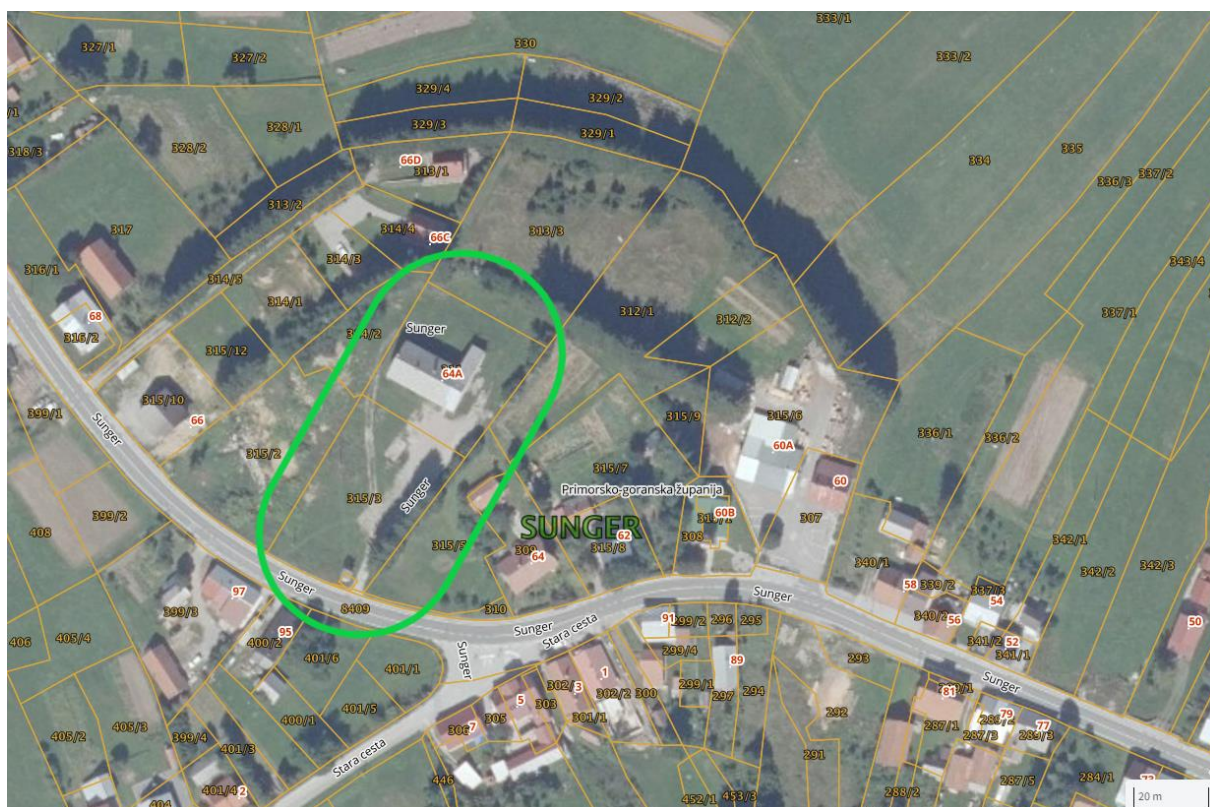
Slika 2. Lokacija napuštene osnovne škole u naselju Sunger