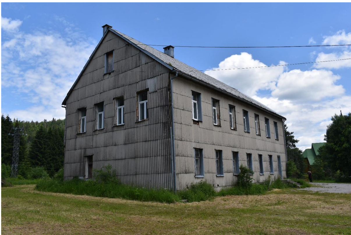
Slika 1. Napuštena škola u naselju Sunger