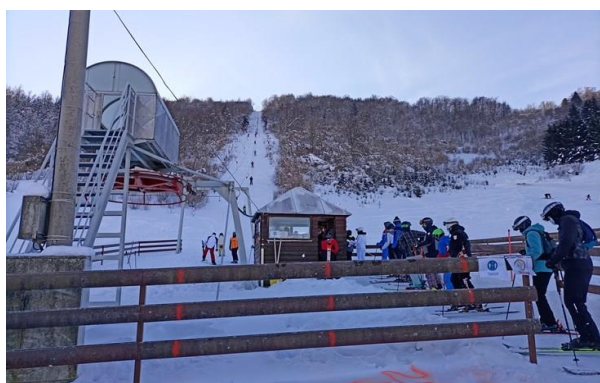
Slika: Skijalište Čelimbaša

Postoje dva manja skijaška centra SC Mrkopalj. Prvo je skijalište Čelimbaša koje se nalazi na 832 m nadmorske visine do visine od 1084 m na vrhu sa vučnicom dužine 720m. Skijalište se sastoji od 3 staze, turističke - crvene staze duljine 1350m, crne - duljine 500m i sunčane - također crvene staze - duljine 1000 m. Čelimbaša je svakako jedno od starijih i dugotrajnijih skijališta i slovi za skijalište s najvećim potencijalom u Gorskom kotaru, a proširenjem novih staza, gradnjom umjetnog jezera za lakše zasnježenje i nabavkom žičare sa većim kapacitetom, što je u planu općine Mrkopalj, Čelimbaša ima sve preduvjete da bude i vodeće skijalište u našoj zemlji.