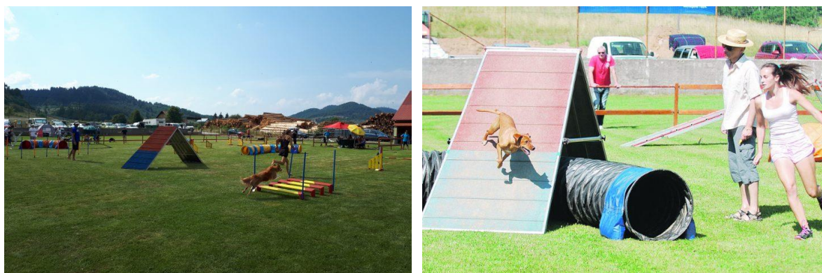
Slika: Agility Mrkopalj