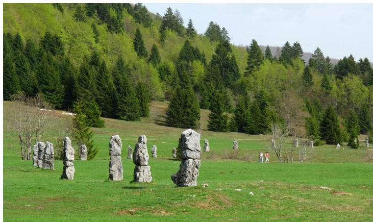
Slika: Memorijalni lokalitet Matić poljane

Vezano za gore navedeno, u Mrkoplju se održava poznat kulturni program, Muzej zime, koji je zamišljen kao zimska bajka koja se priča kroz različite programske elemente i otkriva brojne mitove i legende ovog kraja, ali i one novije dobi koji govore o zimama koje su nekada bile, prisjećajući se prvih oblika turizma i ugošćavanja putnika namjernika. U žarište se stavlja i ono po čemu je Mrkopalj poznato i priznato središte, a to je Škola mira koja nastavlja raditi u širem kontekstu međunarodne zajednice Memorijalom mira i programima kojima se zagovaraju važne teme mirovnih integracija i tolerancije u društvu. Program se provodi u okviru projekta Centriphery koji sufinancira program Europske unije Kreativna Europa uz podršku Ministarstva kulture Republike Hrvatske. Program se planira ponovno pokrenuti u Mrkoplju tijekom idućih nekoliko godina. Projektom se planira obnoviti društveni centar u kojem je i započeta Škola mira u vrijeme Domovinskog rata te edukativnim i interaktivnim programima širiti ideju mira i nenasilnog rješavanja sukoba u društvu.