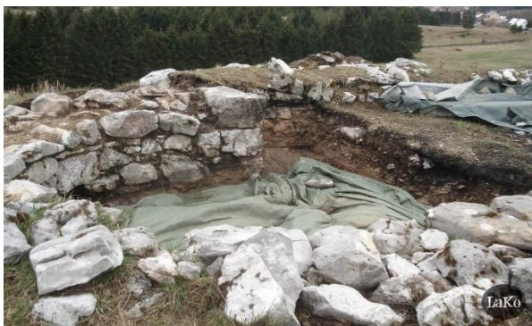
Slika: Arheološko nalazište Fortica nad Crikvenom

Fortica nad Crikvenom u Mrkopaljskom polju je najstarija crkvice u Mrkoplju. Zidine su iskopane 1976. g.: 4,5 X 8 m. Pretpostavlja se da je crkvice iz 13. ili 14. stoljeća uz moguće groblje uz nju. 2019. godine, na ovom arheološkom lokalitetu, provodila su se istraživanja u sklopu projekta »Putovima Frankopana« kojeg je nositelj Primorsko-goranska županija, a financiran je sredstvima iz EU fondova. Dio tog projekta je istraživanje frankopanske baštine i taj dio koordinira Arheološki muzej u Zagrebu koji surađuje s Hrvatskim restauratorskim zavodom, riječkim Pomorskim i povijesnim muzejom te Muzejom Grada Crikvenice. Zajednički su istraživanja bila provedena na pet frankopanskih lokacija, a mrkopaljska Fortica jedna je od njih. Prvi su put istraživanja na ovome mjestu ostvarena tijekom sedamdesetih godina prošlog stoljeća i to kao dio projekta istraživanja prapovijesnih nalazišta na području Like i Gorskog kotara. Već u početnom dijelu istraživanja bili su uočljivi obrisi oltara srednjovjekovne crkvice koja se nalazila na tom mjestu. Lokacija bi mogla biti uključena u turističku ponudu i prezentaciju ovoga kraja.