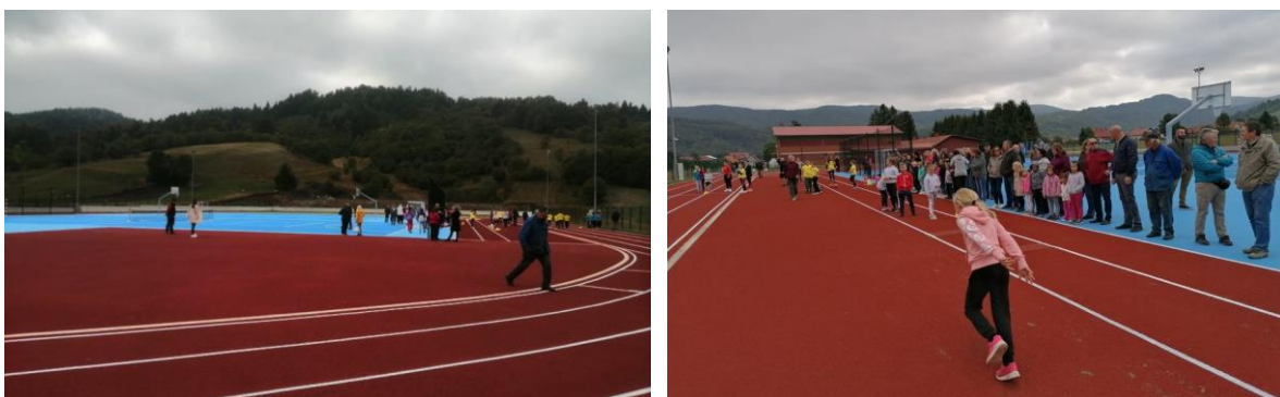
Slika: Atletska staza u Mrkoplju

Tu je i projekt uređenja malog sportskog centra kraj osnovne škole koji je u završnoj fazi asfaltiranja nakon kojeg će se na jednom mjestu imati mogućnost korištenja sportskim terenima za atletiku, rukomet, tenis, košarku, skok u dalj i bacanje kugle.